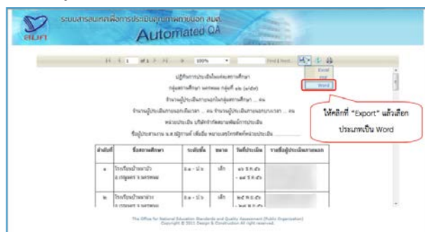
รูปแสดงการส่งออกแผนงานหรือเอกสารในรูปแบบต่างๆ