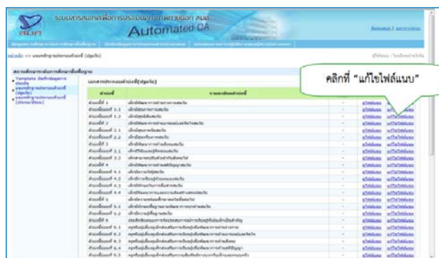
รูปแสดงการบันทึกผลคะแนนและจัดเก็บเอกสารของตัวชี้วัด