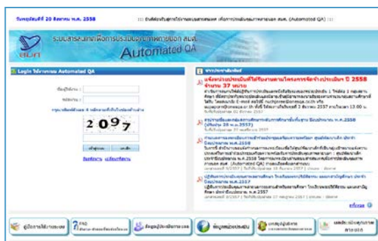
รูปแสดงหน้าจอหลักของระบบ