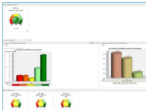
รูปแสดงการติดตามผลการดำเนินงานฯ ระดับฝ่าย