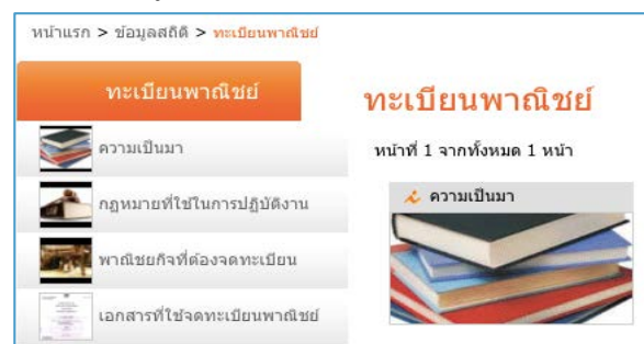
ข้อมูลการจดทะเบียนพาณิชย์